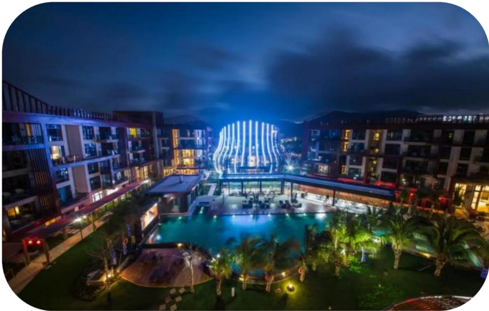
三亚雅阁温泉度假酒店园林改造及温泉工程