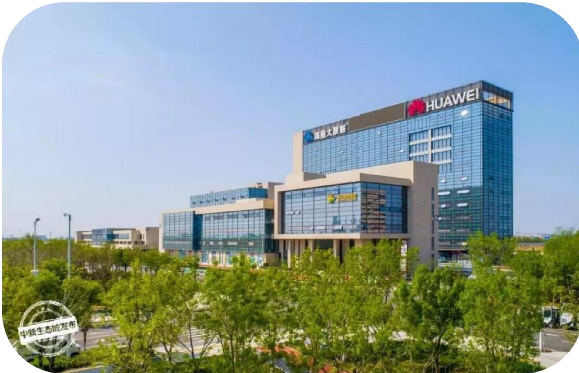
华为滨海基地办公场所