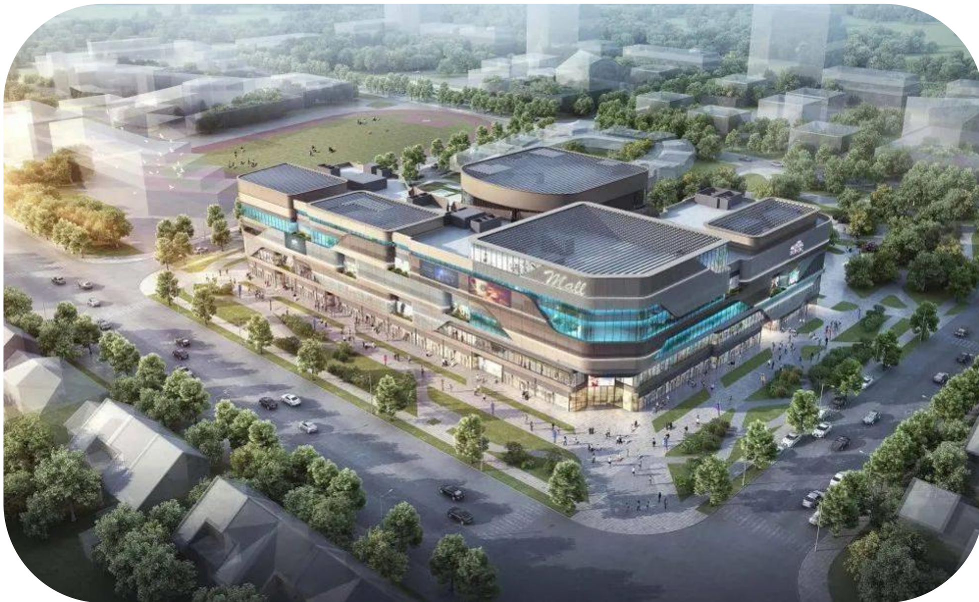
中新天津生态城临海新城第二社区中心项目