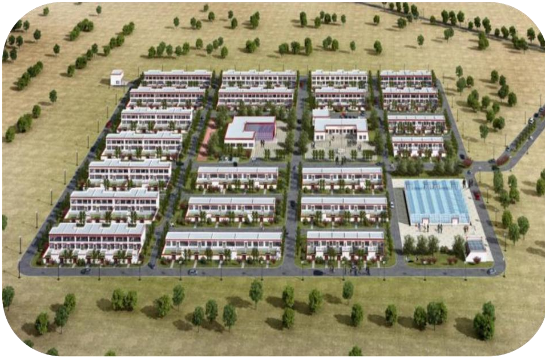
西藏阿里地区极高海拔生态搬迁抵边新村热琼沟安置点建设工程