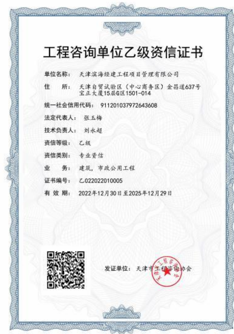
工程咨询单位资信评价证书