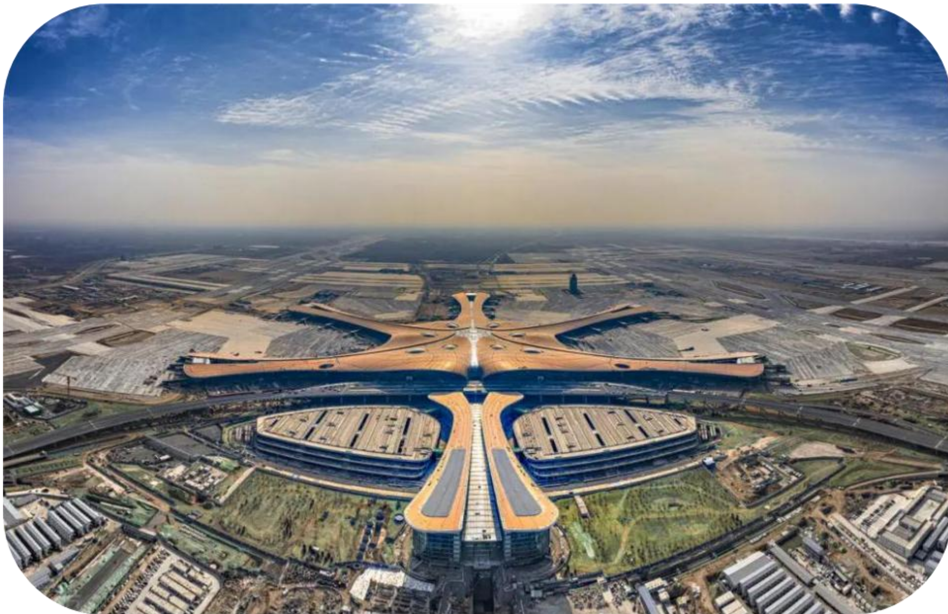
北京新机场地面加油设施工程全过程造价咨询