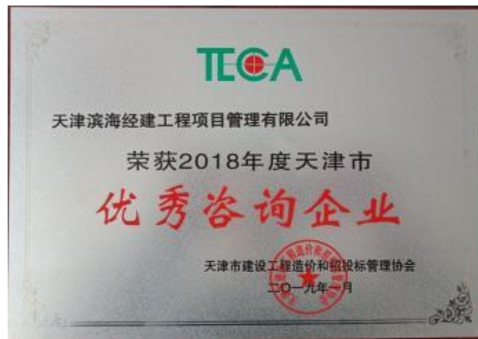
天津市优秀咨询企业荣誉