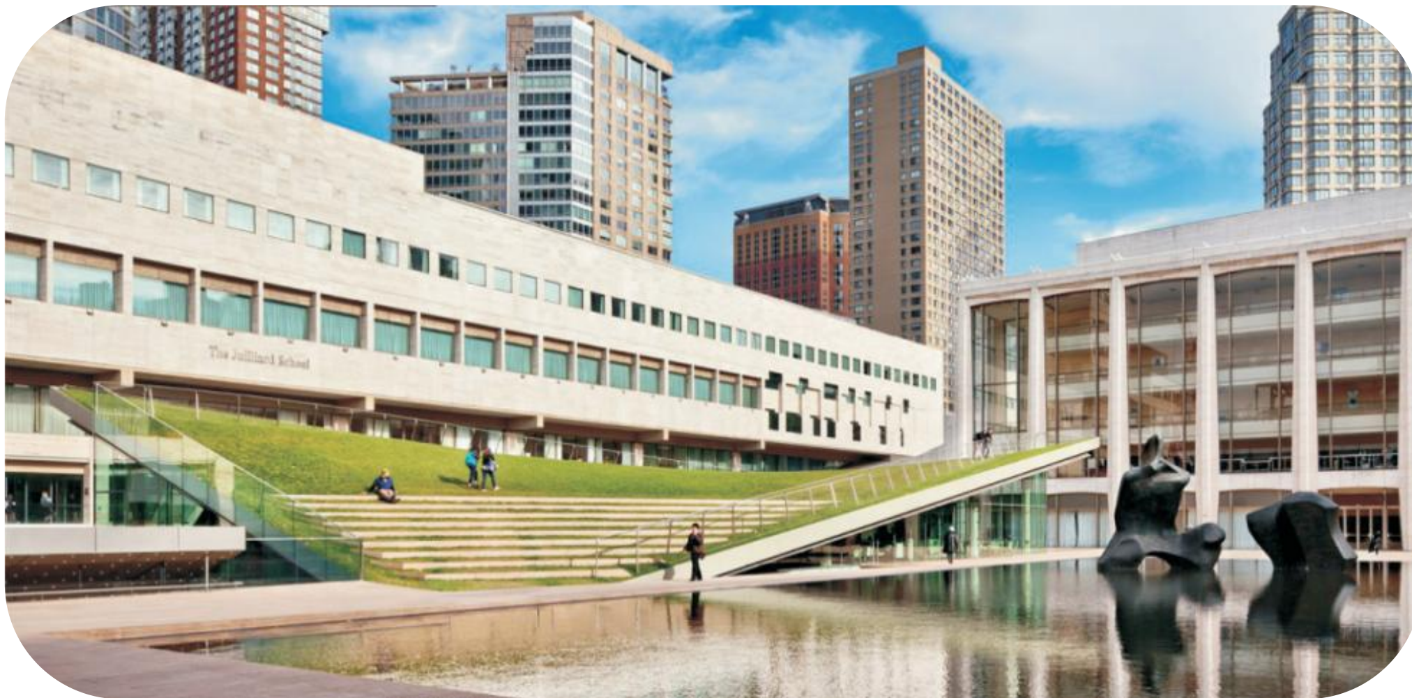
茱莉亚学院周边环境整治工程