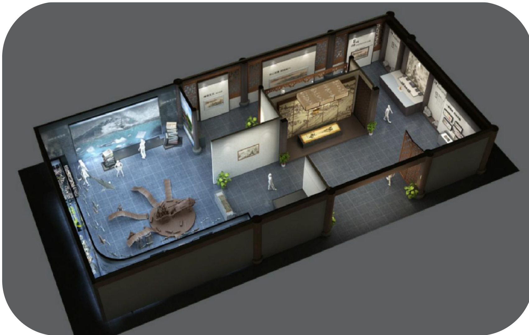
妈祖文化园智慧园区改造工程