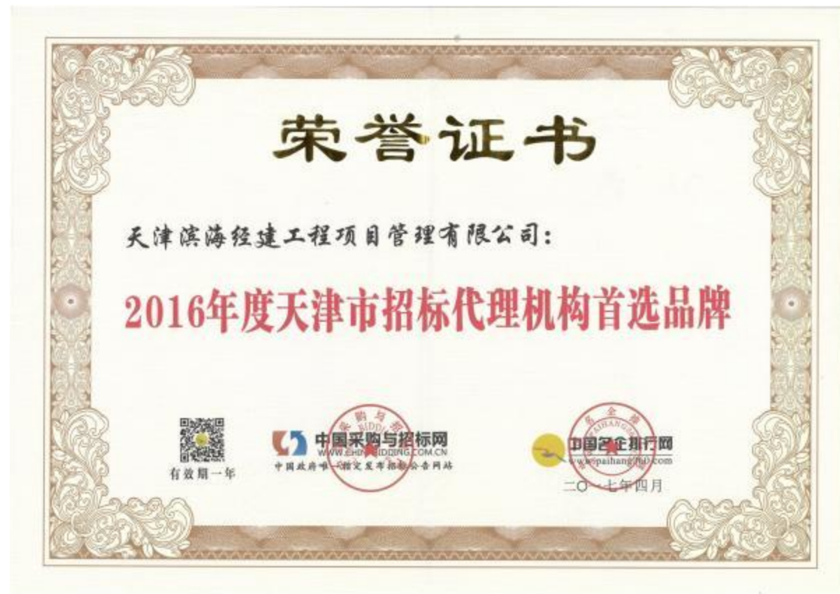
天津市招标代理机构首选品牌