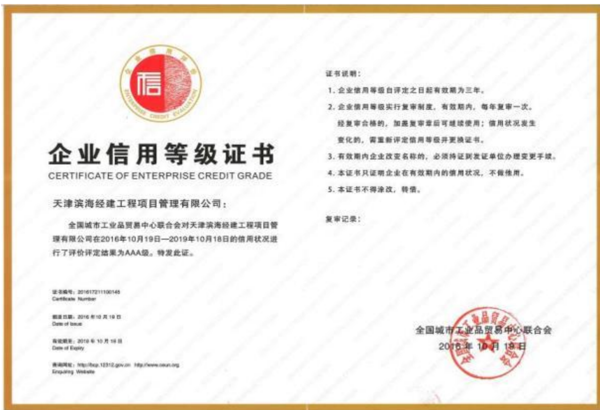
企业AAA信用认证（工信部）