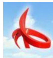
德州市陵城区 教育局