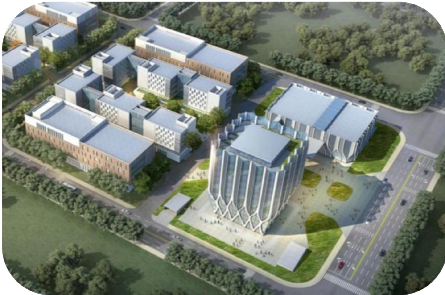
中新天津生态城生物医药产业园项目