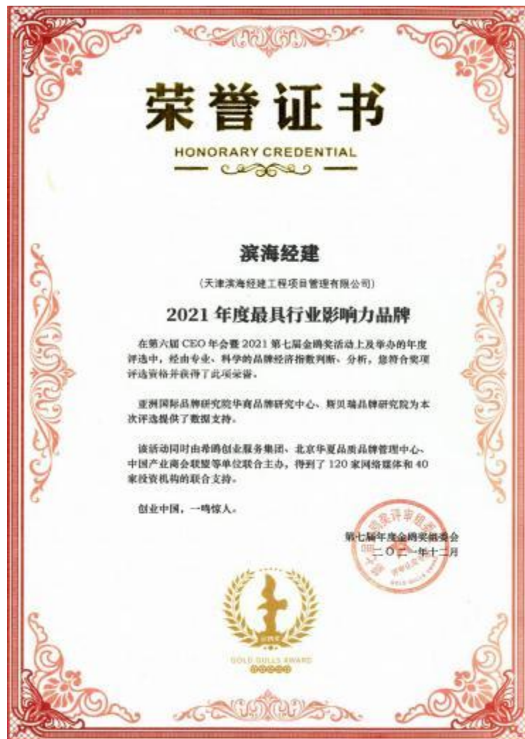
最具行业影响力品牌