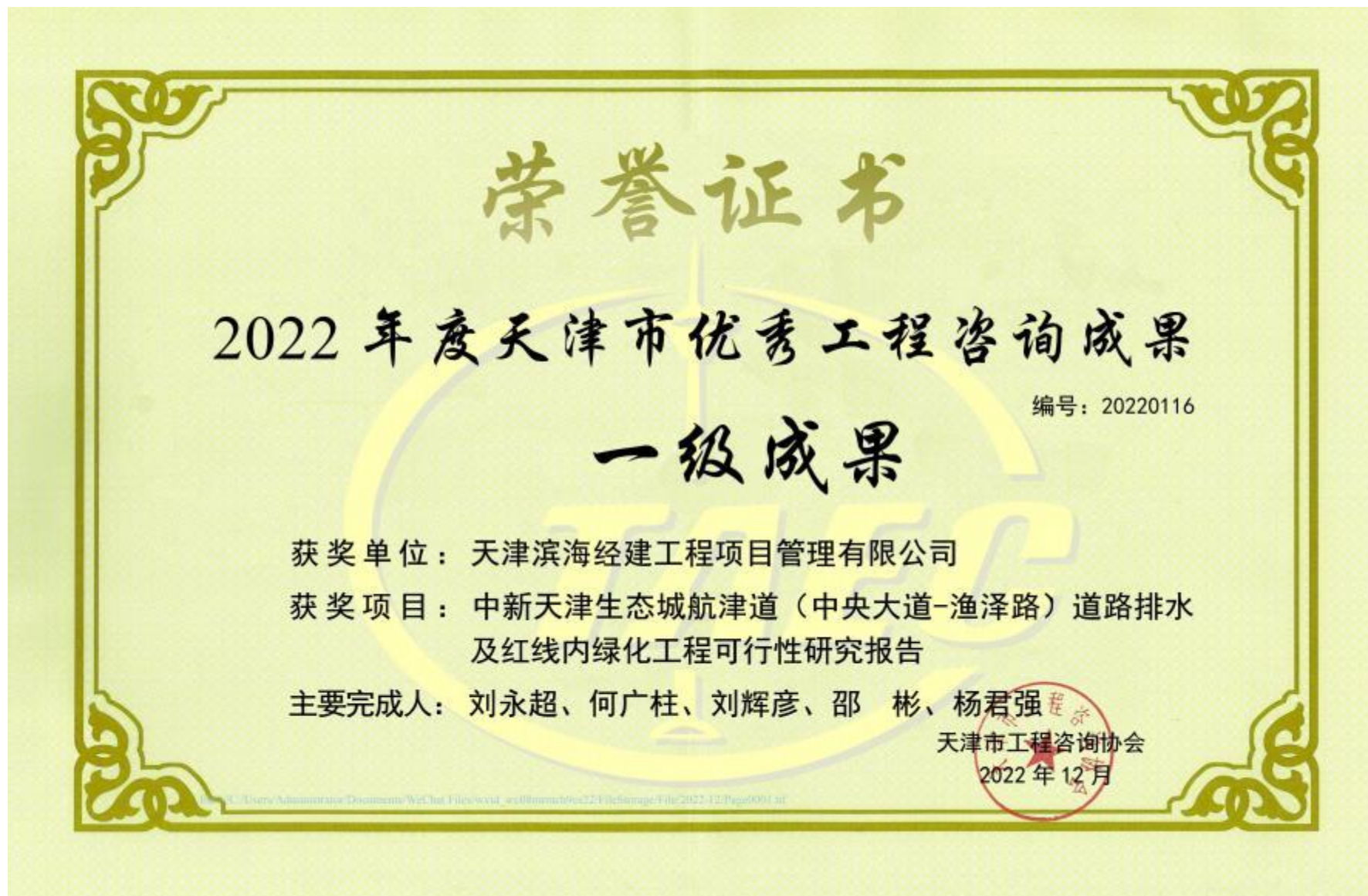
优秀工程咨询成果 一级成果