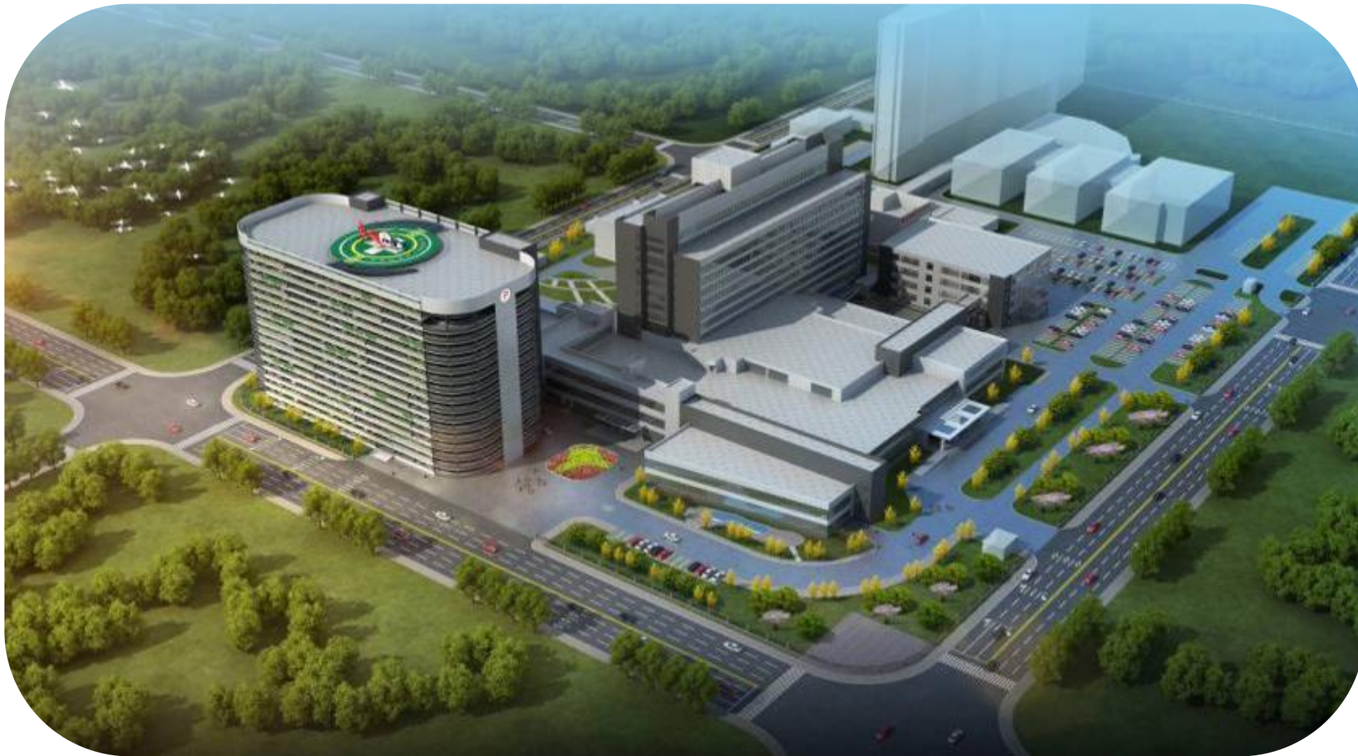
泰达心血管病医院新建停车楼工程