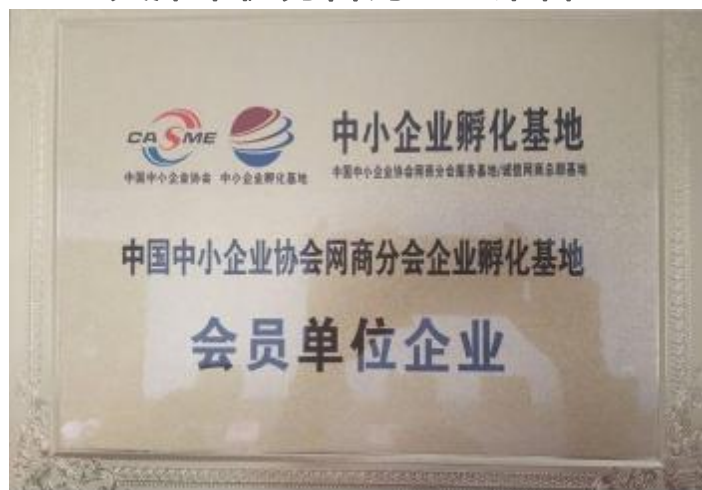
中国中小企业协会会员单位企业