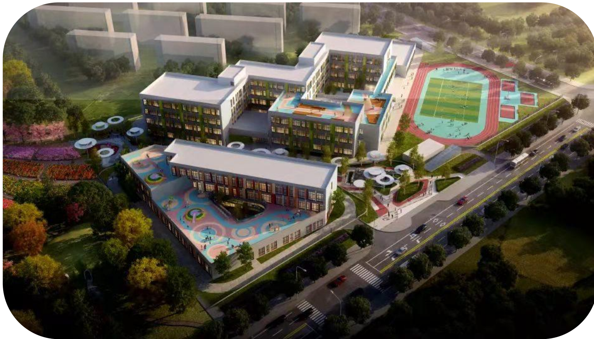
中新天津生态城中福中加地块第二幼儿园项目